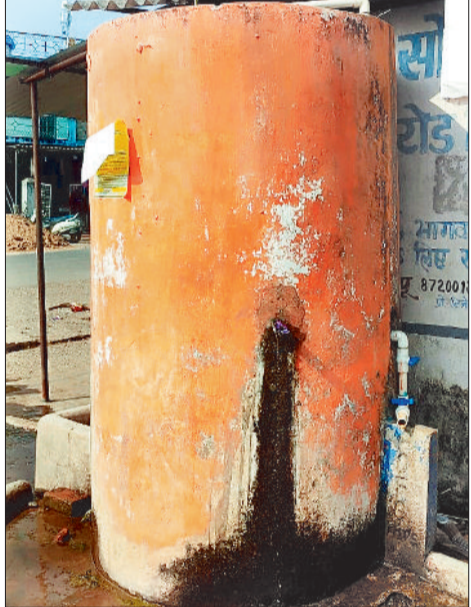
बैकुण्ठपुर। सोनहत के मजार चौक के पास स्थित छोटी टंकी की से पेयजल व्यवस्था की गई है। इसमें लोगों के पेयजल के लिए नल लगे हैं, लेकिन उनमें टोटी नहीं लगी है, इससे पेयजल जरूरत से ज्यादा बर्बाद होता है।