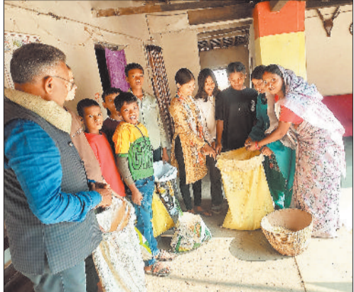
हरिभूमि न्यूज | बैकुण्ठपुर

प्रदेश के प्रमुख लोक पर्वों में शामिल छेरता पर्व को लेकर जिलेभर में उत्साह का माहौल देखने को मिला।