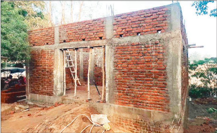
निर्माणधीन गणेश मंदिर।